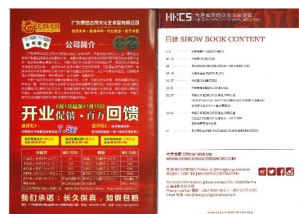
1 版全页 (左)